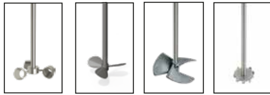
Aspas de cono Aspas tipo hélice Aspas tipo espiral Aspas de dispersión y homogenización