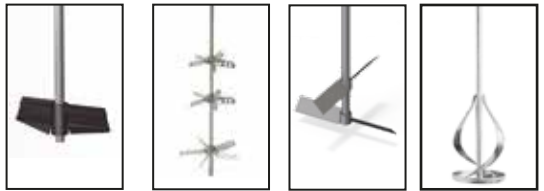
Aspas de paletas plástica (GRACO) Aspas tipo sombrilla (GRACO) Doble plana de paletas Aspas tipo cinta