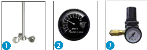
1 Aspas agitadoras 2 Medidor de RPM'S 3 Regulador de presión de aire