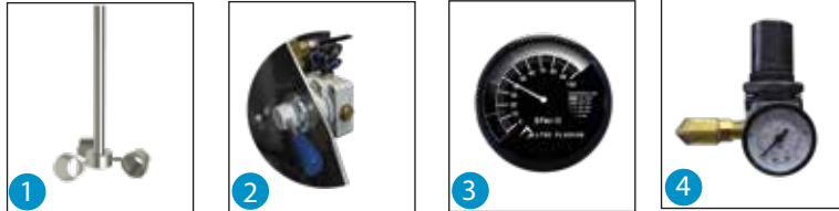
1 Aspas agitadoras 2 Válvula de posición 3 Medidor de RPM'S 4 Regulador de presión de aire